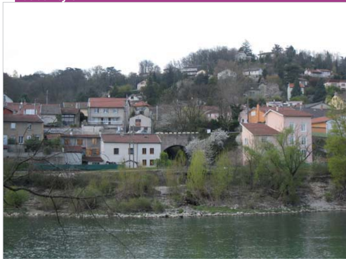
Vue de Neyron

E-mail : jph@golf-lasorelle.com Capacité d'accueil : 55 convives (jusqu'à 80 sur réservation) Tarifs : Plat du jour golfeur et formule golfeur à 13,50€ et 14,50€. Menus gastronomiques de 26€ (en semaine le midi uniquement) à 42€. Carte. Cuisine gastronomique Fermeture : lundi soir et mardi soir Descriptif : Cuisine de produits frais. Grenouilles / commande. Repas + initiation golf.