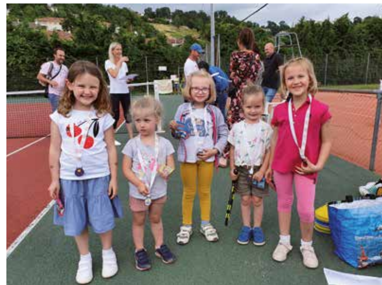
Les graines de champions commencent dès l'âge de 4 ans.

Pour plus d'informations : www.bibliotheques-ccmp.fr Tél : 09 73 64 94 28