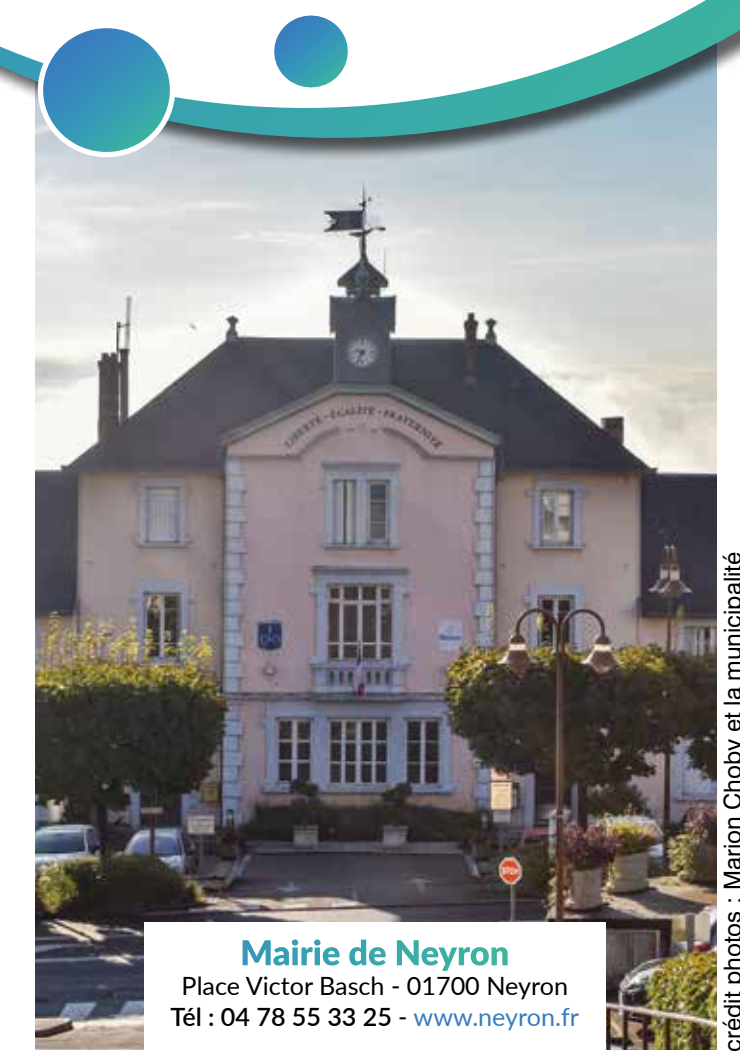
Mairie de Neyron Place Victor Basch - 01700 Neyron Tél : 04 78 55 33 25 - www.neyron.fr