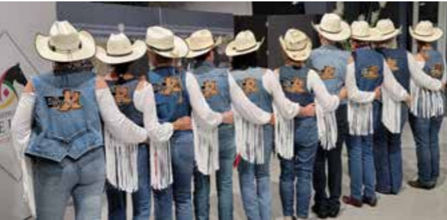
Notre groupe "animation danse en lignes"

Contact : soudesecolesdeneyron@gmail.com