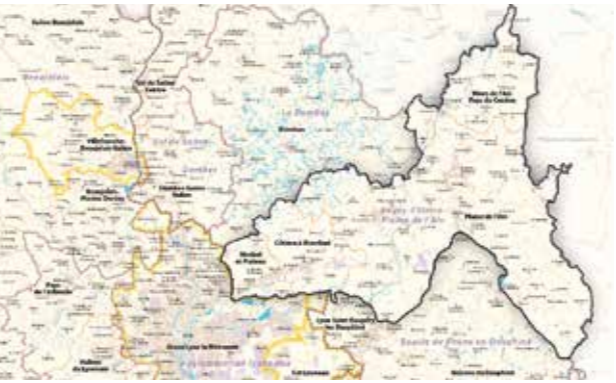
Situation du territoire du BUCOPA sur la carte de l'administration territoriale de l'aire métropolitaine Lyon Saint-Etienne

La réunion s'est conclue sur la volonté partagée de poursuivre une co-construction du projet de territoire. La révision du PLU intégrera les orientations du SCOT révisé, afin d'accompagner un développement harmonieux, respectueux du cadre de vie et des particularités de Neyron.